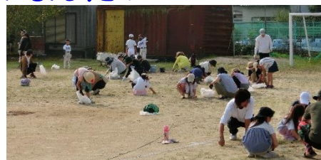
【一生懸命抜いていただきました】

20日(日)に行われたPTA美化作業におきましては、多くの皆様にご協力いただき、ありがとうございました。本年度は草刈り機もたくさん準備していただき、大変効率よく作業ができたのではないのでしょうか。お世話をいただきました生活福祉委員の皆様、また、事前に溜めますの砂出しをしていただきました父親委員の皆様、本当にありがとうございました。