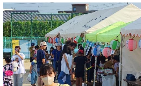
【出店も盛り上がっていました！】

また、同日夕方には4年振りの「祭りあじさか」が開催され、盛り上がっていました。私自身初めてなものですから、どのようなお祭りか想像できていませんでしたが、各学団や団体から出店が出され、手作りで作られているのだと分かり、とても感心させられました。